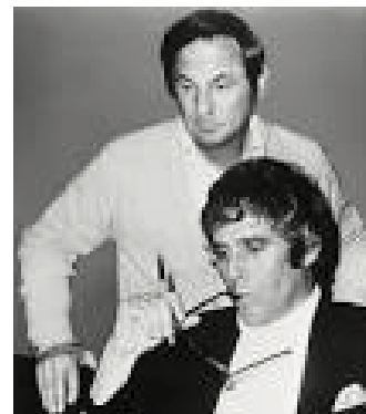
Hal David, Burt Bacharach